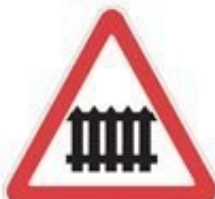
+ railroad crossing