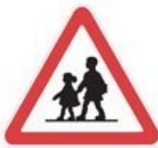
+ school zone