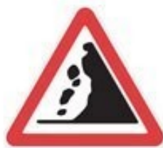
+ falling rocks